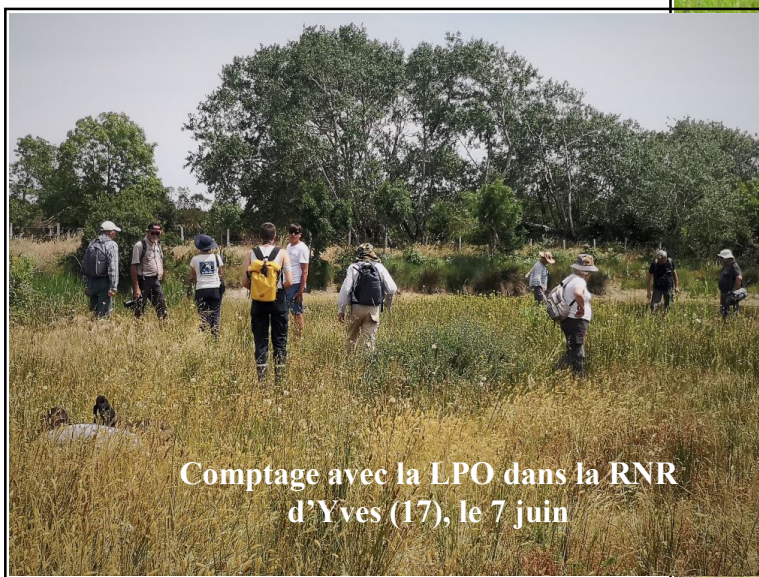
Comptage avec la LPO dans la RNR d'Yves (17), le 7 juin