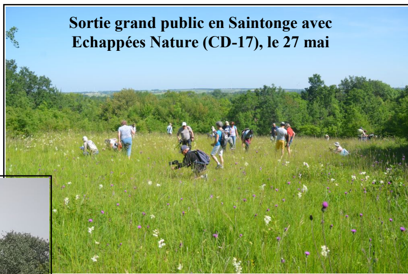
Sortie grand public en Saintonge avec Echappées Nature (CD-17), le 27 mai