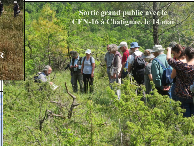
Sortie grand public avec le CEN-16 à Chatignac, le 14 mai